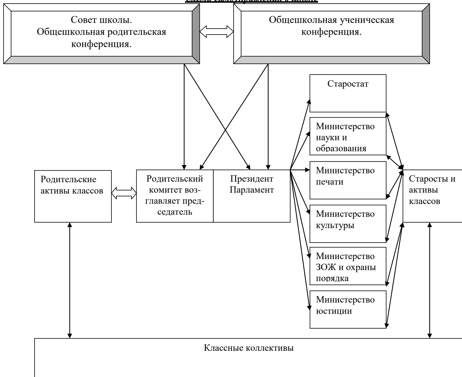
Схема самоуправления в школе

Школьная Демократическая Республика «Созидатели» следует статьям Конституции, принятой 29 января 2004 года.(см.приложение№2)